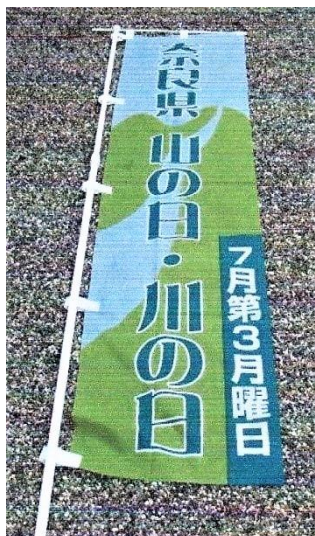
「奈良県山の日・川の日」の旗

※ 実施 or 雨天中止 を、前日 PM7:00 頃に各ご家庭にメールで連絡します。